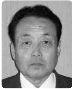
吉富町教育委員長

地方議会が抱える大きな問題は、政策づくりを執行機関の行政に独占されていることです。そもそも、地域の多様な意見を吸収する機能は、住民と日常的に接する機会が多い議員が集う議会の方が、役場（行政）より優れて