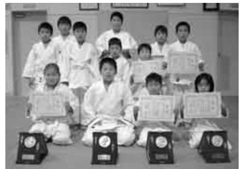
▲吉富少年柔道教室