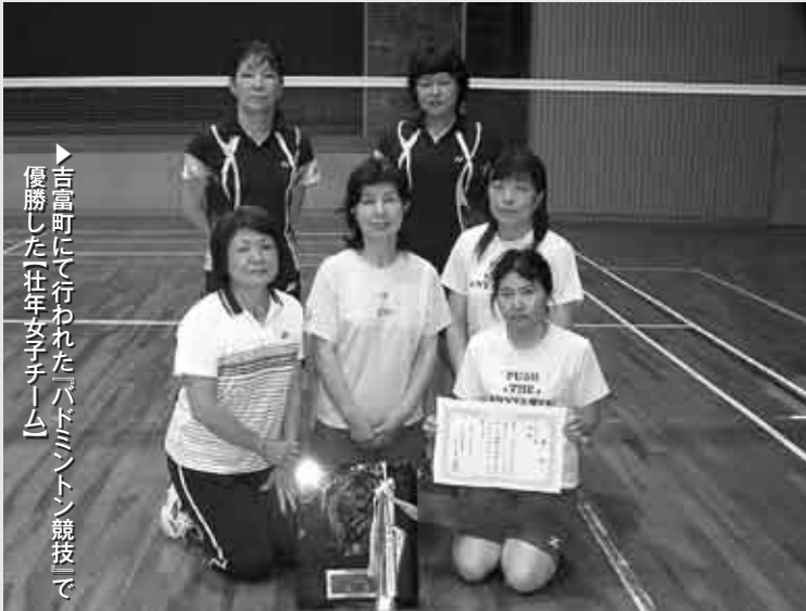
▶吉富町にて行われた『バドミントン競技』で優勝した「壮年女子チーム」

去る7月4日(日)に第49回築上郡民体育大会(築上郡体育協会主催)が開催されました。吉富町は『バドミントン競技』の担当会場となっており、そのほか、上毛町にて『バレーボール競技』、築上町にて『ソフトテニス競技』、『卓球競技』がそれぞれ行われました。吉富町からは全競技に選手が出場しました。主な大会結果は次のとおりです。