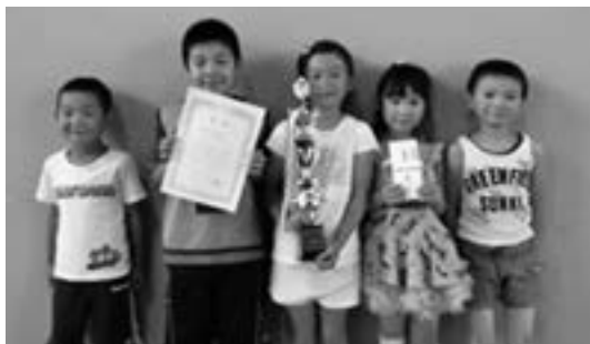
▲低学年優勝 別府キッズBチーム