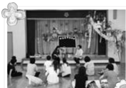
七夕祭り(ペーパサートを楽しむ親子)