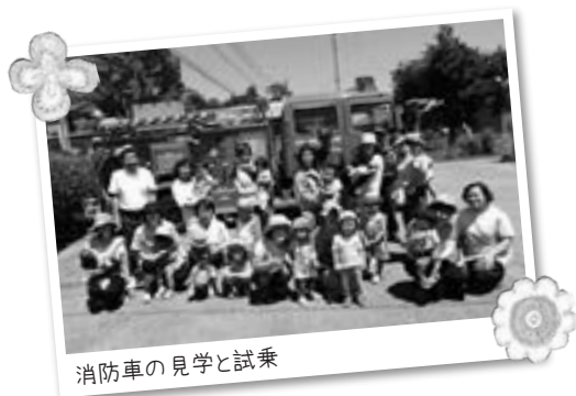
消防車の見学と試乗