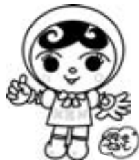
人権イメージキャラクター 「人KENあゆみちゃん」