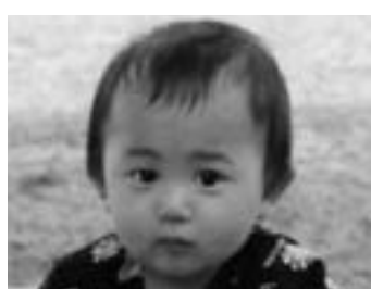
ちかし 榎 睦ちゃん 男