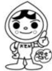
人権イメージキャラクター 「人KENまもる君」