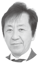
中家 章智 議員