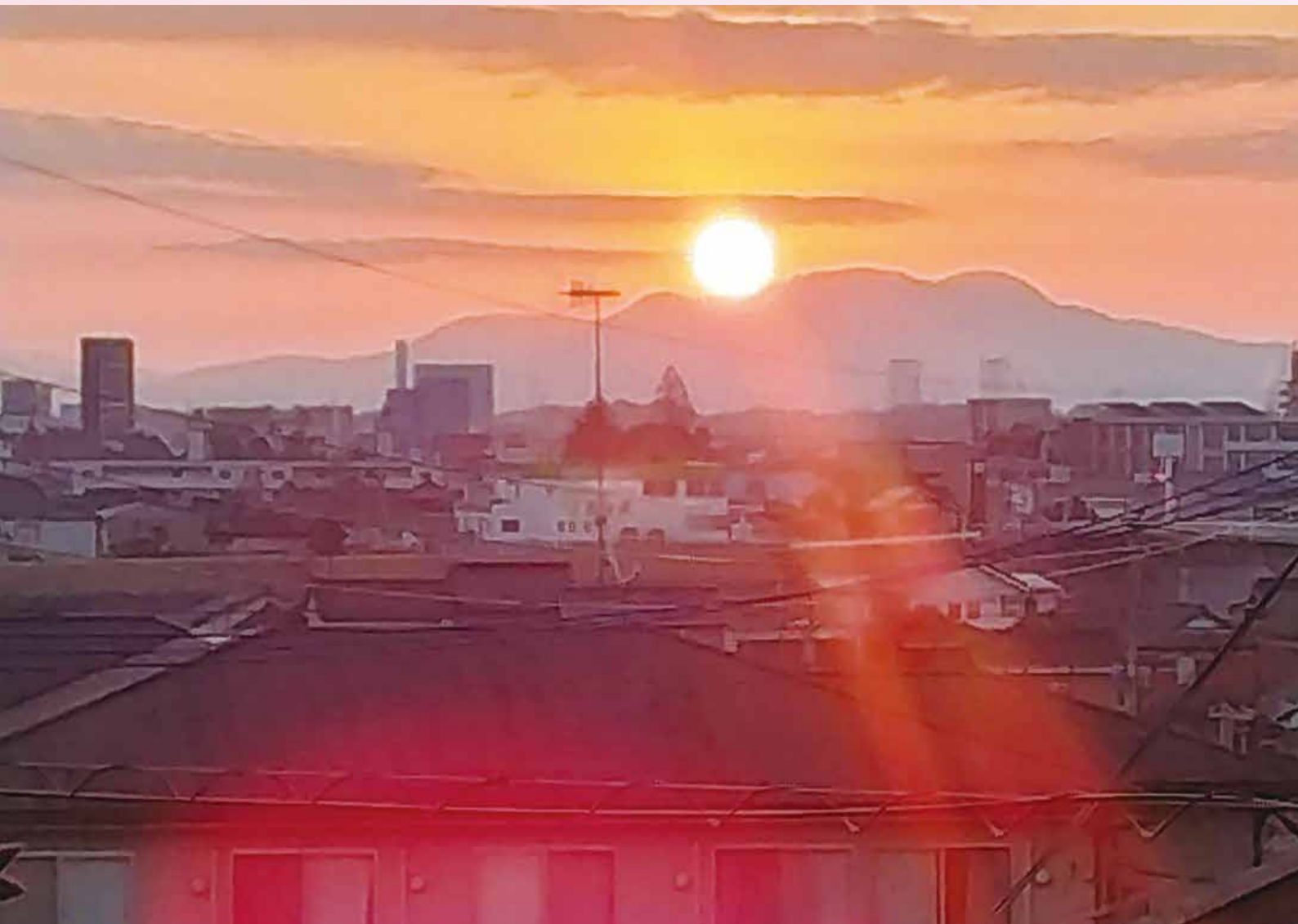
天仲寺山から望む初日の出