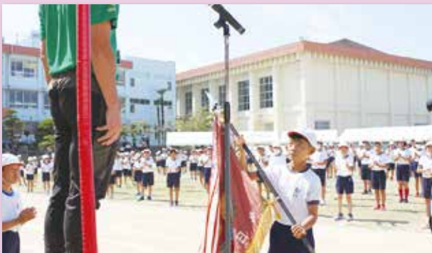
吉富小学校 スポーツ集会