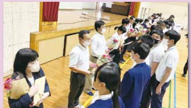
吉富中学校 教師感謝の日