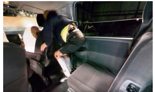
後部座席の乗員が前部へ投げ出され、運転者に衝突する状況

後部座席で受ける衝撃は前部座席で受ける衝撃と変わりありません。 シートベルトは大切な命綱です。