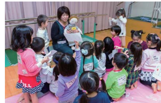
小学校入学の準備 5歳児健診(平成27年度入学～)

充実していると評価の高い既往の子育て支援メニューに加えて、小さなまちだからこそできる切れ目ないきめ細やかな支援を子育ての全段階において行います。日本一の「子育て全力応援トータルパッケージ」の構築を目指します。