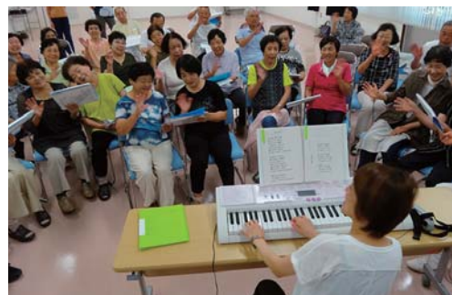
ふれあいサロン(老人福祉センター)

町の代表的な製造業である製薬工場のイメージと、町内の診療所密度等医療・介護水準の高さ、「命とくらしの輝き」「心とつながりの輝き」というまちづくりの方向性を活かし、住民の心身にわたる健康づくりを展開する「メディスン・タウン」としての新たな町のイメージ形成を図ります。