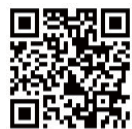
観光・物産サイト (平成28年4月リニューアル)