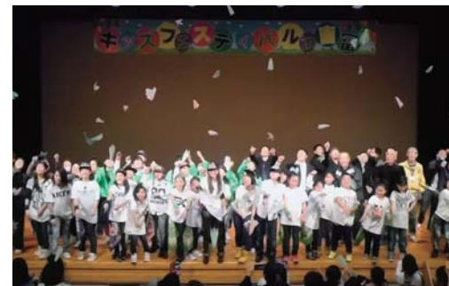
キッズフェスティバルin吉富

地域とともにある学校づくり、地域ぐるみ活動の支援(キッズクラブ・体育協会等)、英会話ふれあい事業やふるさと吉富町を知る活動の実施により、町の将来を担う子ども達の多様な個性や能力の開花を支援します。