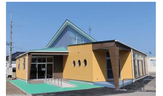
子育て支援センター(放課後児童クラブ室棟)(平成28年3月完成)

「放課後の居場所ゾーン」の整備、放課後児童クラブの充実(施設整備と対象を6年生まで拡大)、地域住民による見守り体制の強化の支援を行い、子どもたちの居場所づくりを推進します。