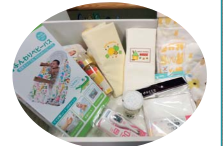
出産家庭に配布 ベビーボックス (平成28年4月開始)