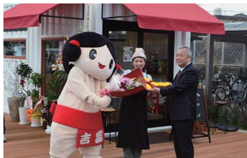
チャレンジショップ1号店「アンドカフェ」(平成28年3月開店)

町周辺の消費需要に対して、各種サービスの供給を担う店舗、事業者等の起業・創業支援を行うとともに、経営者等に対する経営塾を開催しその人材育成を図ります。