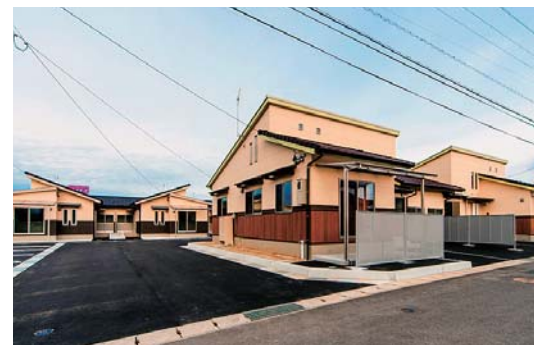
町宮山王団地(平成28年3月完成)

マイホーム取得時や新婚世帯が居住地を選択する際、吉富町が選ばれるよう各種補助事業を実施するとともに、その移住・定住を後押しするため、住宅用地やアパート・借家の整備等の支援をあわせて実施します。