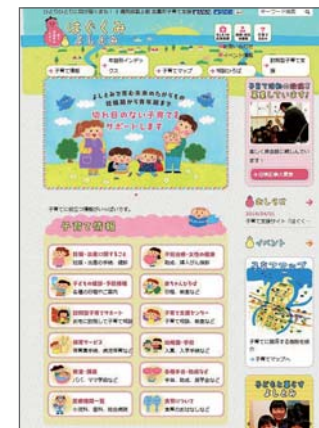
子育て支援サイト(平成28年4月開設)