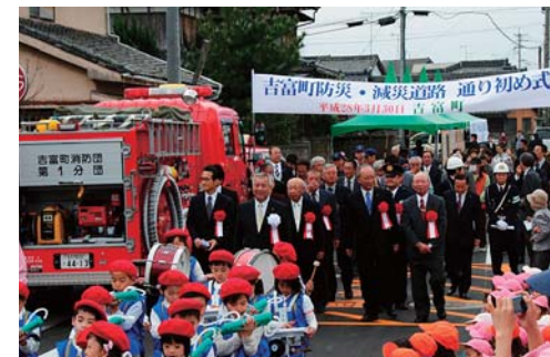
防災・減災道路(平成28年3月完成)

住居に接道する道路が狭い住宅地域では、空家・空地が増加しています。世代をつないで長く安心して住み続けることができる町とするために、生活道路の拡幅整備を促進します。