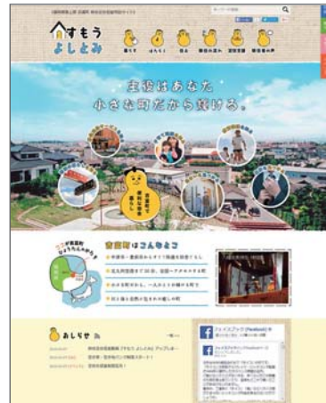
移住定住促進特設サイト(平成28年4月開設)

移住定住促進特設サイトの開設、地域情報の発信の仕組みづくり、マスメディアや雑誌、地元企業のネットワークを活用した情報発信を実施します。また、SNS等を活用した町出身者の絆づくりを推進します。