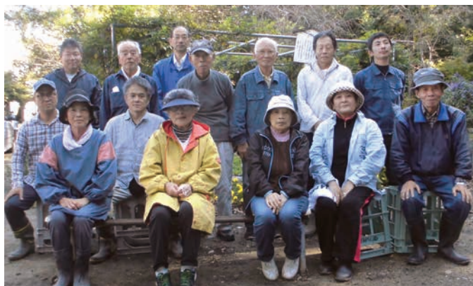
御山会と地元草野球チームの皆さん

御山会の皆さんが大きな愛情をもって管理している天仲寺公園を、ぜひ皆さんも散策してみてくださいはいかがでしょうか。