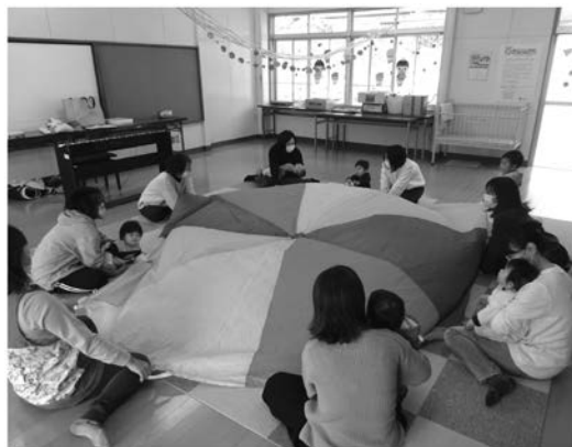
カラフルな布を使って遊びました。