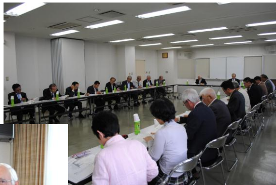
吉富町総合計画審議会