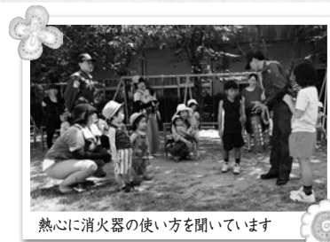
熱心に消火器の使い方を聞いています

7月31日、防火意識を高め災害時の対応を図るために、火災発生時の避難訓練・消火訓練