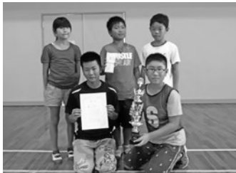
▲高学年優勝 ホワイトタイガーチーム(喜連島)