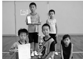
▲低学年優勝 小犬丸下Bチーム