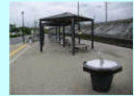
日時計・東屋・駐輪場