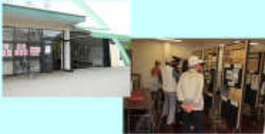
吉富町ふるさとセンター