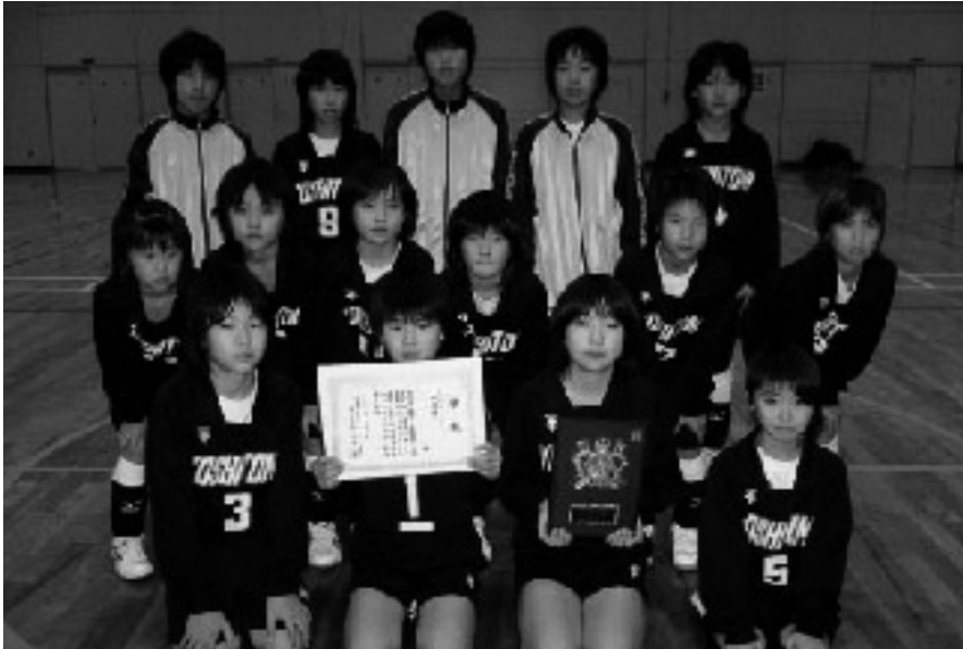
準優勝した吉富ジュニアの選手たち

十二月十一日(日)に、遠賀・中間地域で開催された「平成十七年度ヤングライオンバレーボール大会」において、吉富ジュニアバレーボールクラブが見事に準優勝しました。 この大会は、五年生以下が対象となる新人戦で、北部地区(遠賀、中間、京築)の計二十一チームが参加するなか、同クラブ