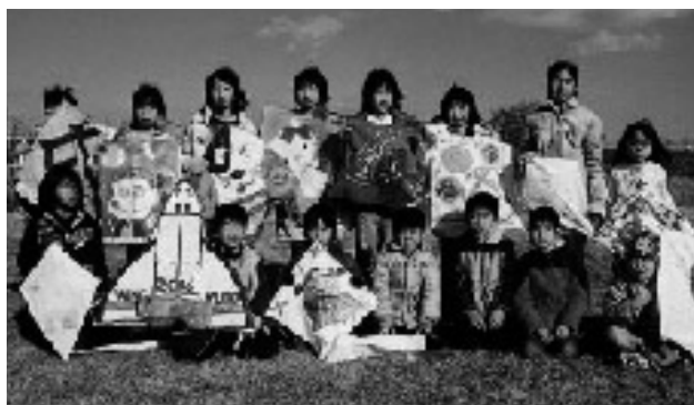
かっこいいで賞1位の 幸子上子ども会