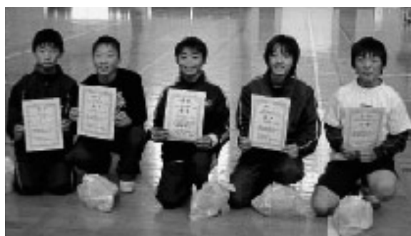
優勝のラリアットチーム