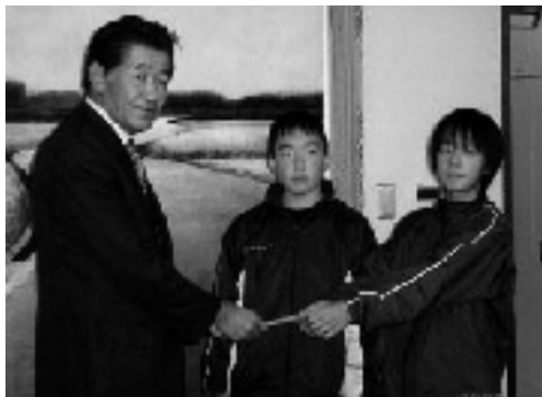
寄付金を手渡す児童

平成十七年十二月九日に吉富小学校児童会の代表者が役場町長室を訪れ、「吉富町の社福祉事業のために役立ててください」と、吉富町社会福祉協議会への