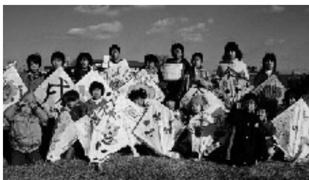
あがつたで賞1位の 界木子ども会