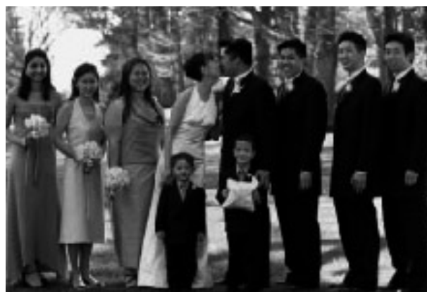
(左から右) 3人のBridesmaids、Bride、Groom 3人のGroomsmenです。 左から3人目はMaid of Honorで、右から3人目は Best Manです。 下の子供は指輪を持っているRing Bearerです。