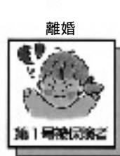
(吉富町役場) 配偶者が脱サラして自営業に