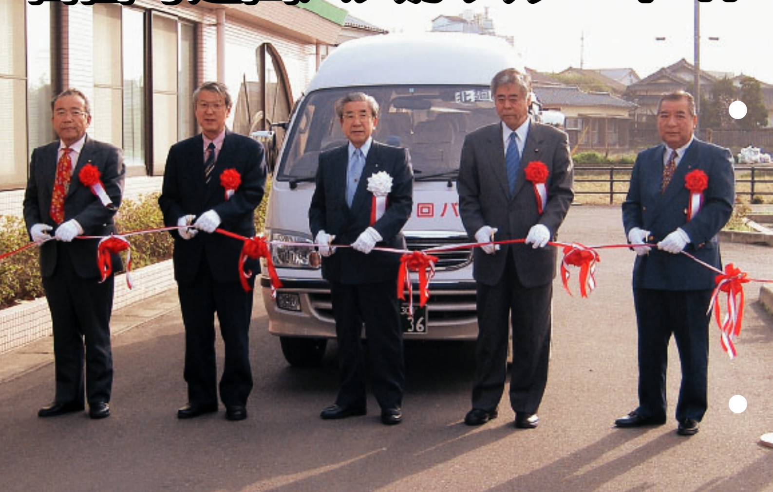
巡回バス出発式のテープカット！

JR吉富駅を始発、終着にして町内を巡回する「吉富町巡回バス」の出発式が、4月1日に行われ巡回バスがスタートしました。