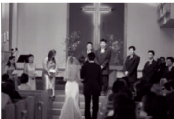
教会の祭壇の前に並んでいる Wedding Party (結婚式の付添人)