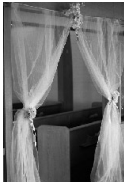
ピンクのカーネーションと桜と白いメッシュという織物で飾った結婚式場の入口

アメリカ人が婚約した後、結婚式までの日数は少なくとも半年から一年間ぐらいあります。なぜかという、結婚式をする場所を探したり、自分が好きなウェディングドレスを買ったり、友達や親戚に送る招待状を作ったりする、たくさんの重要な準備があるからです。日本では結婚式専用の式場やホテルがありますが、アメリカでは結婚式場の代わりに新郎新婦の所属する教会や自分の好きなチャペルにて行います。もし、結婚式を夏にすれば、広い公園、大学キャンパスの芝生や、本人が住んでいる家の裏庭にてアウトドアウェディングをする人もたくさんいます。結婚する場所を見つけたら、どういうふうにするか、何の色のどんな花を使うか、当日の準備も全部結婚する当人達が自分でしなければいけないことです。アメリカで結婚するのは全て自分達で用意なくてはならないので結構大変ですが、人生で一番幸せな日 "Happiest day of your life" とよく呼ばれるウェディングデーのため、皆一生懸命に準備して、結婚式を楽しみにしています。次回はウェディングブレゼントの贈り方、結婚式の費用や結婚披露宴などについてお話しします。