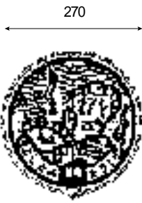
民地内に設置された「公共ます」の鉄蓋部分を上から見た図

で、これまでの下水道工事の際に民地内に「公共ます」が設置されている家屋は、今回使えるようになりました。