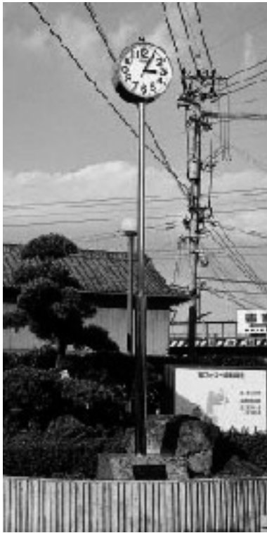
寄贈された時計(フォーユー会館前庭)