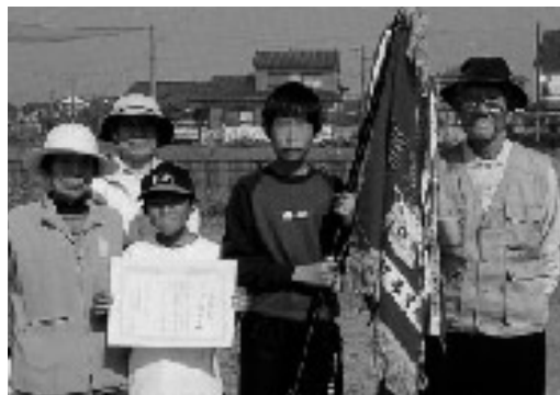
寿会大会・親善大会 優勝の混成チーム