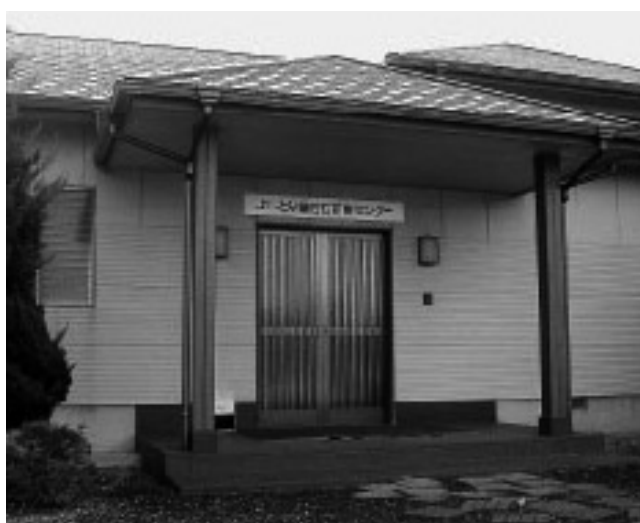
よしみ皇后石研修センター