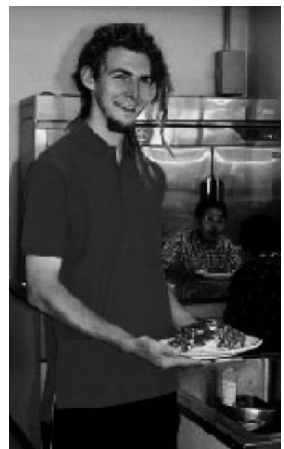
私の作ったスパゲティー (もちろん肉は入っていない)