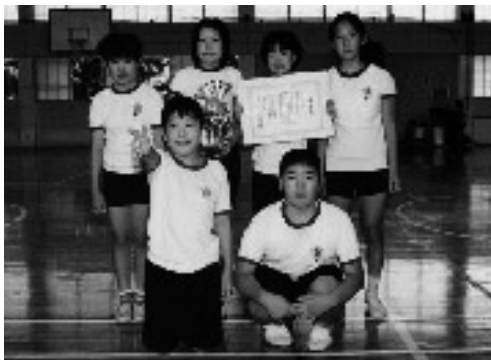
3位のレモンチーム (今吉子ども会)