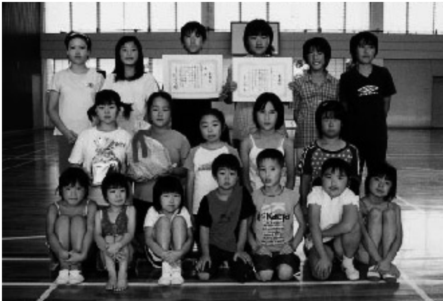
優勝・準優勝・4位と大活躍の喜連島子ども会チーム