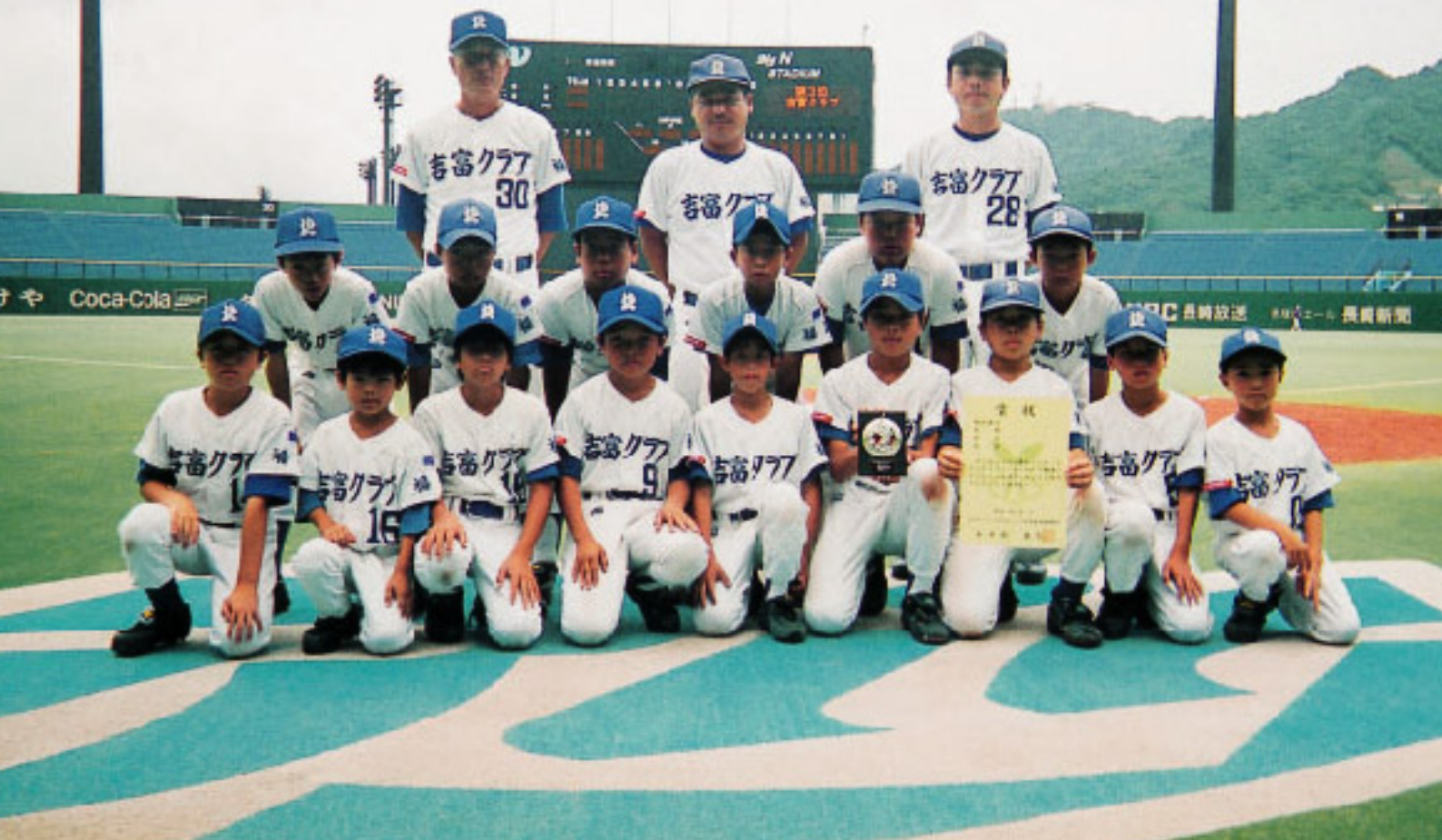
九州大会で3位になった吉富少年野球クラブ

8月15日～17日の3日間、長崎市の長崎県営球場（ビッグNスタジアム）などで開催された「第23回九州ブロックスポーツ少年団軟式野球大会」で、福岡県代表として出場した吉富少年野球クラブが3位になりました。