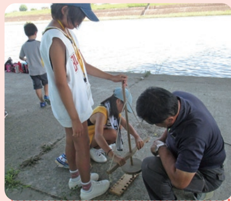
火おこし体験と消防体験を行う参加者