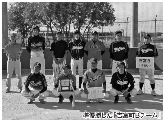
準優勝した「吉富町Bチーム」

吉富町からは2チームが出場しましたが、このうち「吉富町Bチーム」が決勝(vs上毛町:宇野東区チーム)へ進み、準優勝しました。