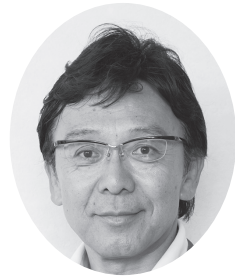
花畑 明 議員