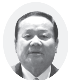
丸谷 一秋 議員