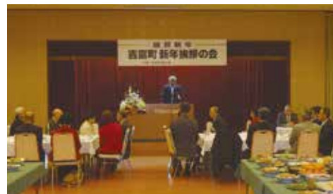
吉富町商工会主催による新年挨拶の会 (1/7開催 約150名が出席)

今年を国の提唱する地方創生の実施元年と位置づけ、執行部の提案に対して精査の上しっかりと議論を深めてまいりたいと思います。