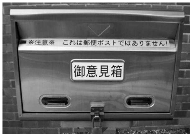
役場玄関前南側に設置している「町民御意見箱」

吉富町では、広く町民の皆様から御意見等をお寄せいただき、これを町政に反映したいと考えています。町政に対し御意見等、何でもお気づきの点がございましたら、封書により役場玄関前南側に設置している「町民御意見箱」に投函してください。