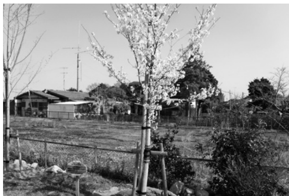
写真：楡生児童遊園