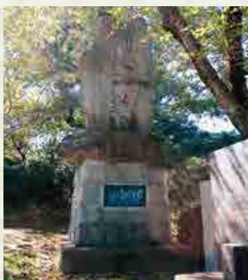
剣心一致の碑(天仲寺公園)