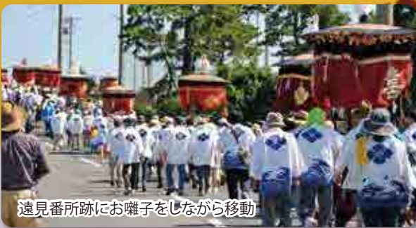
遠見番所跡にお囃子をしながら移動

8月6日、八幡古表神社にて「細男舞・神相撲」が行われ、4年に一度の貴重な歴史的な神事を一目見ようと、町内外から訪れた多数の参拝客で境内が埋め尽くされました。また、同日午前中に行われた「放生会」（仲秋祭）では、山国川河口付近（遠見番所跡）にて“にな貝”や餅を海にまき、船上では細男舞・神相撲の一部が奉納されました。