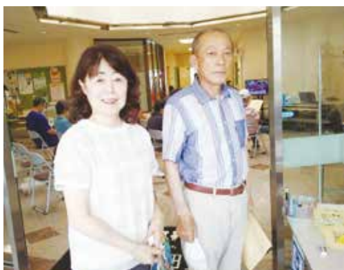
町の特定健診を受診されたご夫妻

なお、今回の健診で余った品物については、健診結果に基づく今後の保健指導等にて活用する予定です。