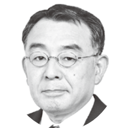
向野 倍吉 議員

答 花畑町長 吉富町まち・ひと・しごと創生総合戦略にて、「地域ぐるみでの教育の推進」そして「地域と共にある学校づくりの推進」を掲げており、その実現に向け、生きる力をつける学校教育、学校・家庭・地域、そして我々行政機関が一体となった教育、生涯学習社会の実現を目指す社会教育を柱とし、取り組んでいます。特に学校教育では、これからの世代を担う子供たちが、この変化の厳しい社会をしっかりと生き抜く力を養うため、我々を含み学校と家庭、地域が連携をし、確かな学力を身につけ、親を大切に、家族・友人と仲よく、心豊かでたくましく生きる子供への教育に情熱を注いでいるところです。