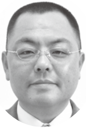
山本 定生 議員