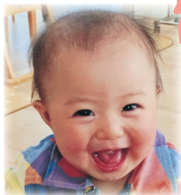
うまばやし 梅林 ほたるちゃん 女