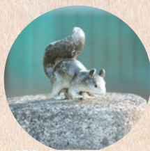
どんぐり公園のリス

風薫る5月、吹き抜ける風や日差しが心地よい季節がやってきました。こんな時期にぜひ訪れていたいただきたいのが、鈴熊山公園です。どんぐり公園のリスふもとのどんぐり広場には珍しい遊具がたくさん。かわいいいリス2匹がお出迎えしてくれます。また、山全体に園路が整備され、風にそよめく木々の音や野鳥のさえずりなどを聞きながら、ちょっとしたハイキングが楽しめます。山の南東部に設置された展望台からは八面山などの山々が一望でき、実に爽快。「福岡県森林浴100選」にも選ばれている、町を代表するヒーリングスポットです。