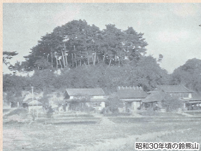
昭和30年頃の鈴熊山

ふもとの公園、数々の文化財、そして豊かな自然。鈴熊山は、世代を超えて楽しめる多様な魅力が凝縮された癒しのスポットです。新緑とそよ風を感じながら、森林浴でリフレッシュしてみませんか？