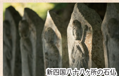
新四国八十八ヶ所の石仏

鈴熊寺にはこのほかにも、色彩豊かな「涅槃絵図」や、室町時代から江戸時代初期の作とされる「木造十一面観音菩薩坐像」など、歴史的価値の高い文化財が多数納められています。また境内には、昭和初期に作られた「新四国八十八ヶ所」の石仏や、作者が他寺に移ったため未完成のまま今に残っている「涅槃石」など、歴史を感じる史跡が点在しています。